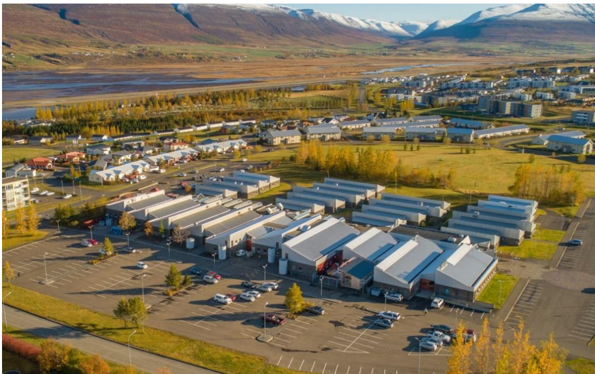
Nýbygging við skólann kemur á norðurplanið með tengigangi við núverandi norðurinngang