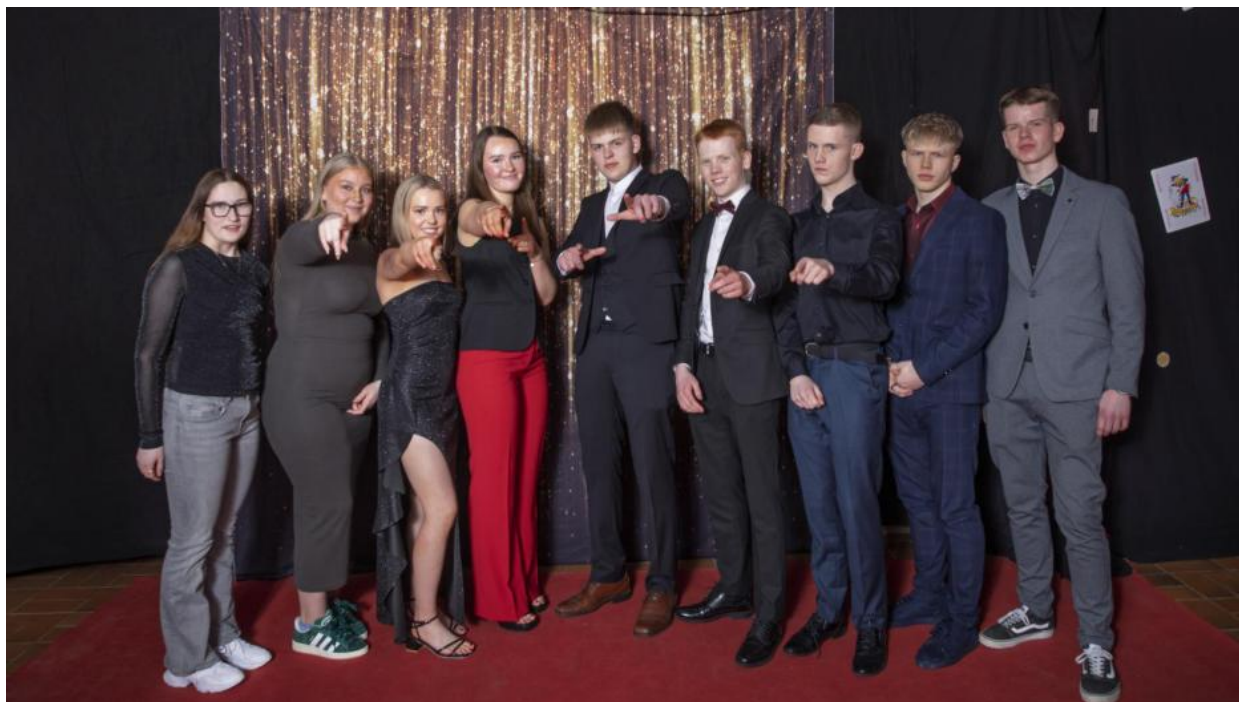
Gleði og glamúr á árshátíð nemenda

Nýnemaferðir voru á Hólavatni í lok ágúst en þar sjá eldri nemendur um dagskrá dagsins. Nýnemum er skipt niður í tvo hópa og farið er sitthvorn daginn. Farið í leiki, grillaðir hamborgarar og sullað í Hólavatni. Markmið þessara daga er að nýnemar á hinum mismunandi brautum skólans kynnist sín á milli. Lokapunktur í móttöku nýnema er nýnemaballið sem haldið var í Sjallanum þar sem nemendur skemmtu sér og dönsuðu fram á nótt með fjölbreyttum hópi listamanna sem komu fram.