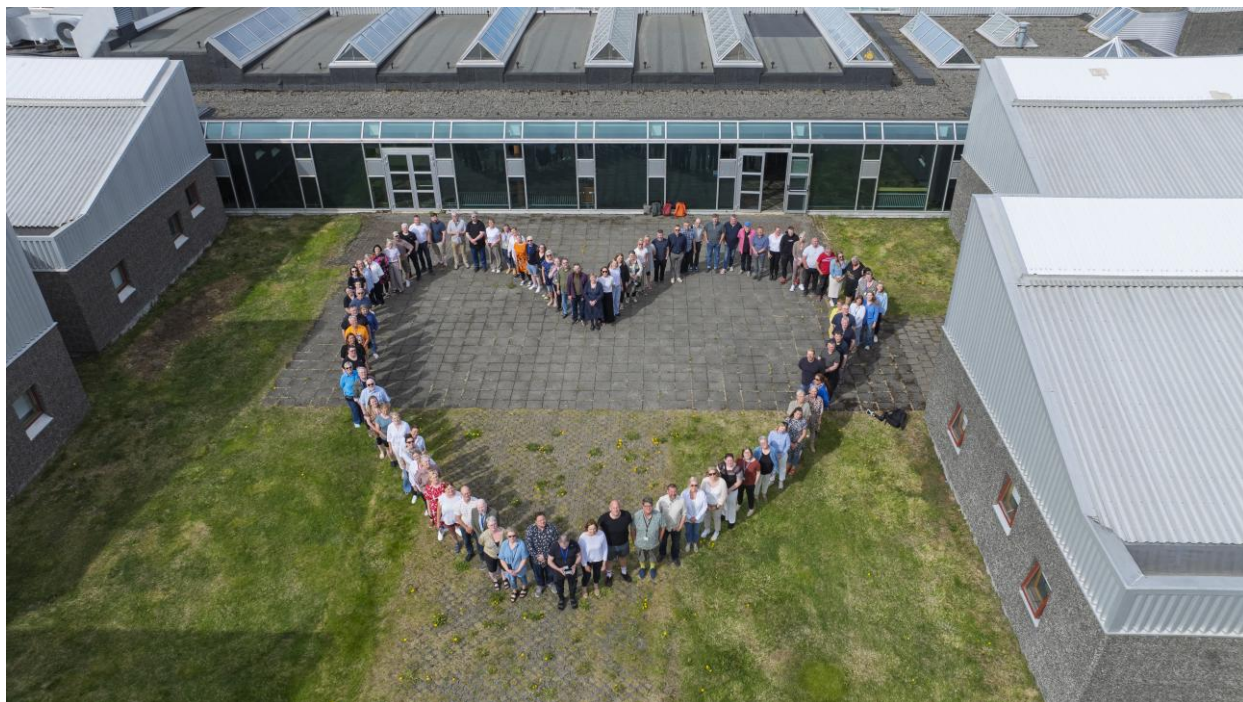
Starfsmannamynd tekin haustið 2025