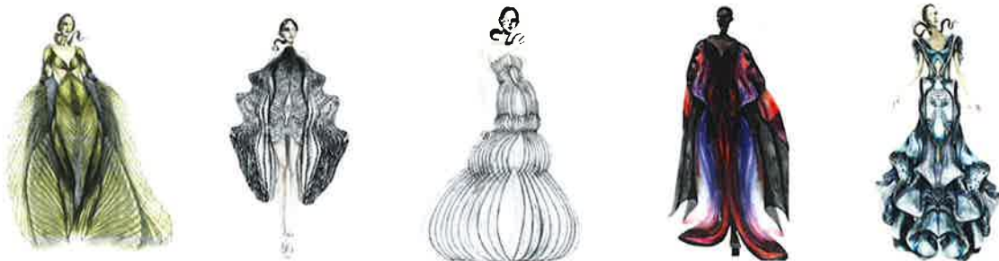
Iris van Herpen

Ýmis ljósrit fagbækur tengdar tiskuteikningu og mannslíkamanum auk efnis af vef. Teikniáhöld s.s. blýantar (F, HB, 3B), vatnsleysanlegir litir, stikleður, skæri og lím.